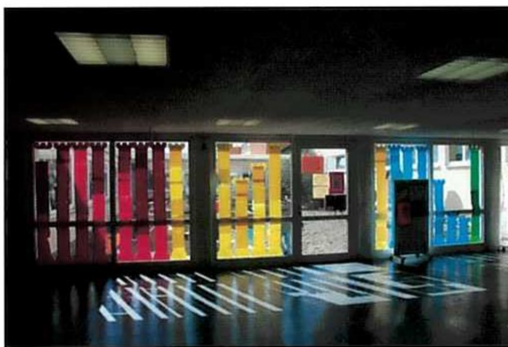
Die Lesetürme der Klassen/Klassenstufen im Foyer der GaK!